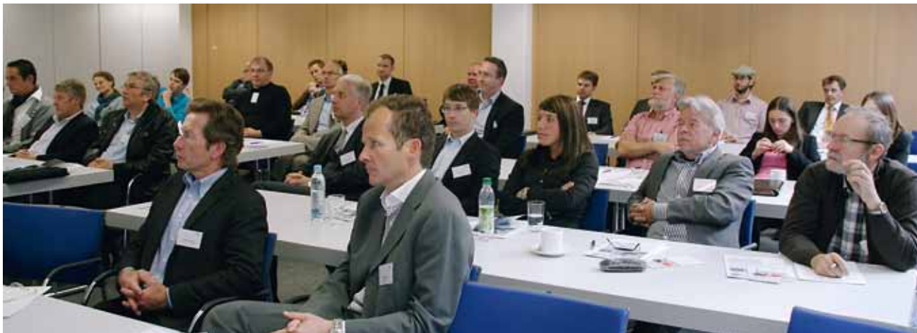
Die Teilnehmer des PrintUpdates verfolgen gespannt die interessanten Fachvorträge

160 TEILNEHMER – EINE WOCHEN GEBALLTE INFORMATIONSPOWER