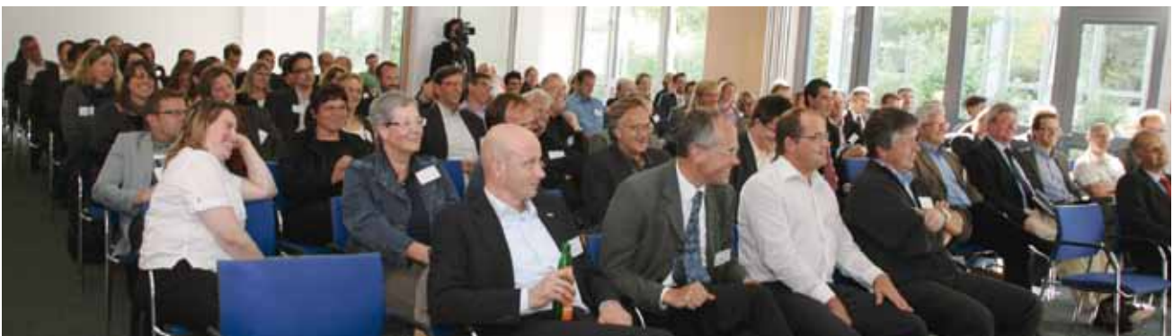
Ein gut unterhaltenes Publikum bei den Keynotes beim 2. Fachkongress „Publishing der Zukunft“