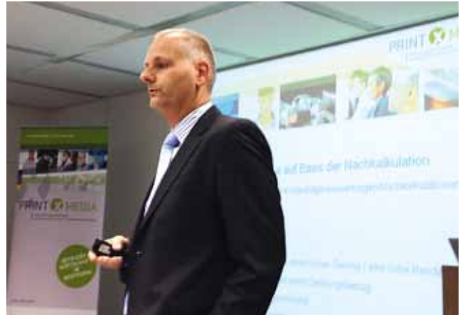
Aktuelle Themen interessant aufbereitet – die printXmedia Roadshow

Die printXmedia Roadshow findet an insgesamt fünf Standorten in Deutschland statt. Weitere Informationen und Termine dazu finden Sie auch unter www.printXmedia.net .