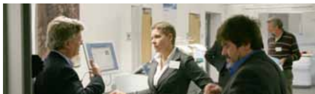
Informationen aus erster Hand am Messestand