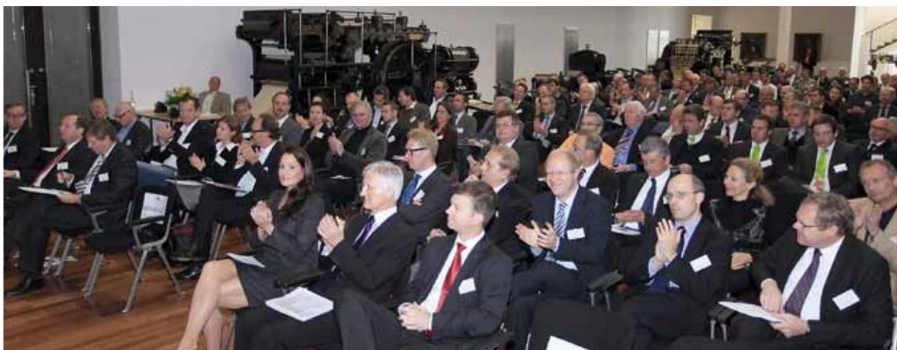
Rund 170 Teilnehmer lauschten gespannt den Vorträgen beim ClusterForum Augsburg