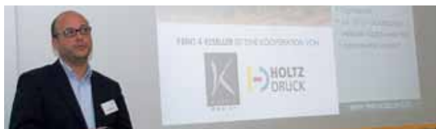
Vorträge mit neuestem Know-how und Produktinnovationen

Der Cluster Druck und Printmedien freut sich, Teil dieses Netzwerks zu sein. Bleiben Sie up to date. Informieren Sie sich über neueste Veranstaltungen, Trends und News der Druck- und Medienbranche in Bayern. Besuchen Sie unsere Seite www.facebook.com/cluster.druck