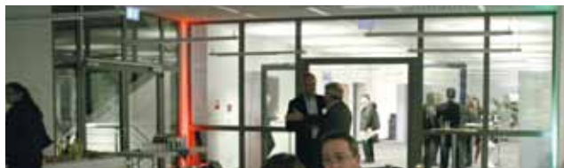
Und zum Schluss ein gemütliches Get-together in entspannter Atmosphäre