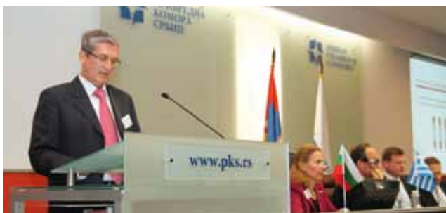
Eröffnung des Balkan Print Forums

ZDM-BERATUNGS- & WEITERBILDUNGSANGEBOTE INTERNATIONAL PRÄSENTIERT