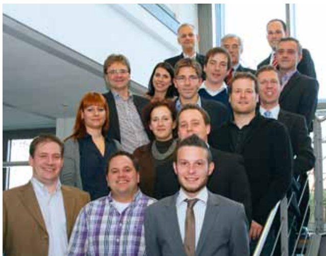
Die neu ausgebildeten „Innovationsmanager Print“

BUNDESWEIT EINMALIGE WEITERBILDUNG ERNEUT DURCHGEFÜHRT