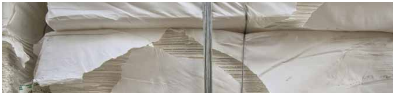
Diskussionsbedarf bei Papier: Wie kann die Qualität der gestrichenen Papiere verbessert und gesichert werden?

FACHDISKUSSION ZU QUALITÄT & VERARBEITUNG VON PAPIER