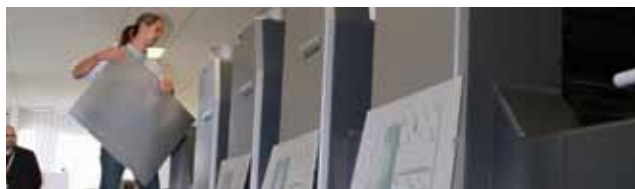
Praxisorientierte Demo für die effiziente Druckproduktion