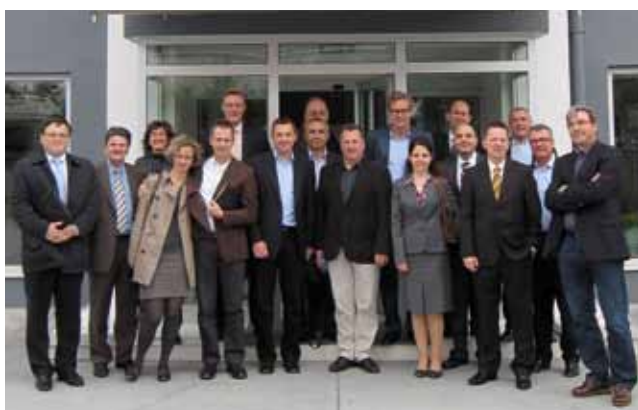
Zufriedene Teilnehmer der „Unternehmerreise Türkei“ hier in Istanbul

TÜRKEIREISE DES CLUSTER DRUCK UND PRINTMEDIEN BEEINDRUCKT TEILNEHMER