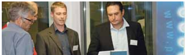
Intensive Gespräche zwischen Referenten und Teilnehmern