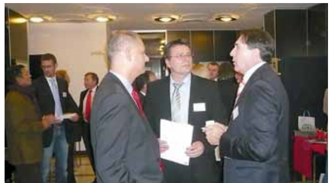
Auditorium und Ausstellung

Die Unternehmer zeigten sich von den zahlreichen Beratungsangeboten des ZDM beeindruckt. Weitere Informationen zum Balkan Print Forum finden Sie unter balkanprintforum.org